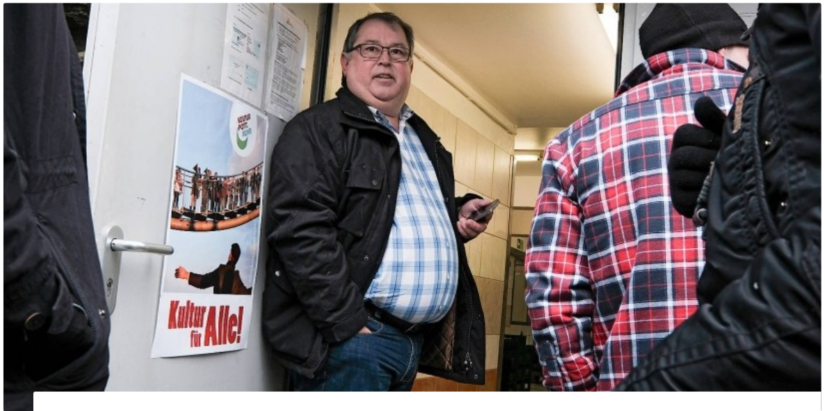
CHEF DER ESSENER TAFEL