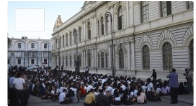
ERDBEBEN IN MEXIKO

Solarstrom lohnt sich wieder! Informiere dich zu Förderung und Eigenverbrauch.