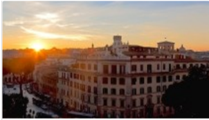
WIEN, PARIS, AMSTERDAM